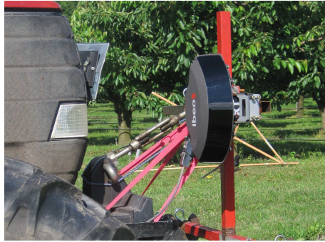
Abbildung 1: Befestigung des Laserscanners ALASCA XT am Traktor

einen Scann-Bereich von 180^\circ in vertikaler und 3,2^\circ horizontaler Richtung [SWS06]. Während der vertikale Messbereich die gesamte Länge der Bäume abdeckt, ermöglicht der horizontale Öffnungswinkel Objekte zu erfassen, die durch andere verdeckt sind.